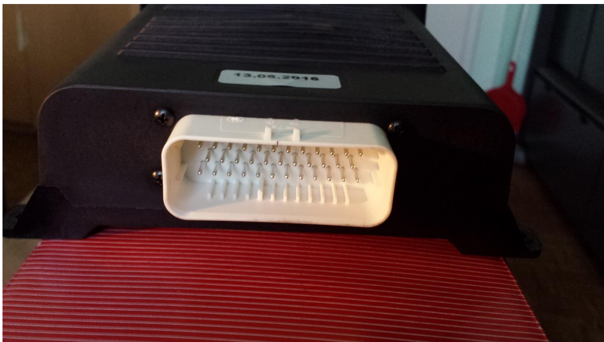
Nappali menetfény 7019075AA