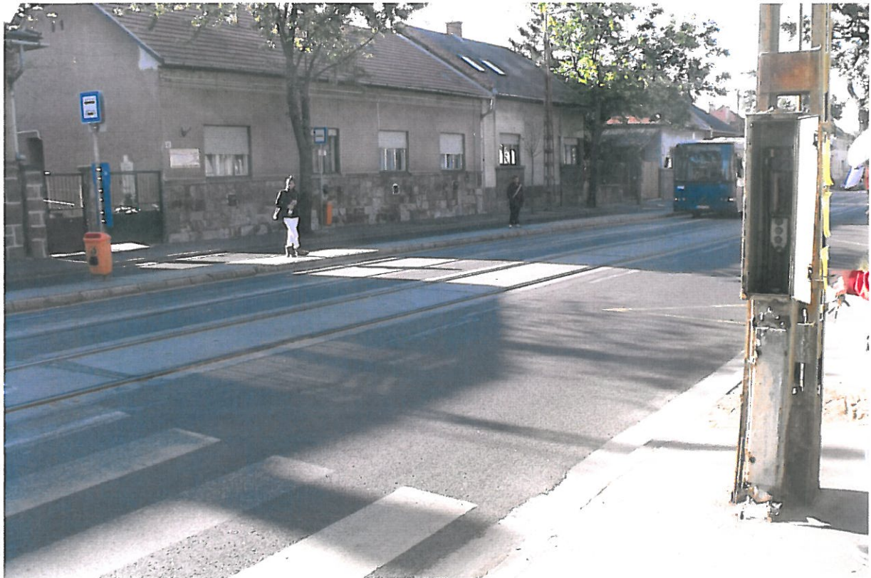
1. ábra Kolozsvár utca 23. negatív szekrény