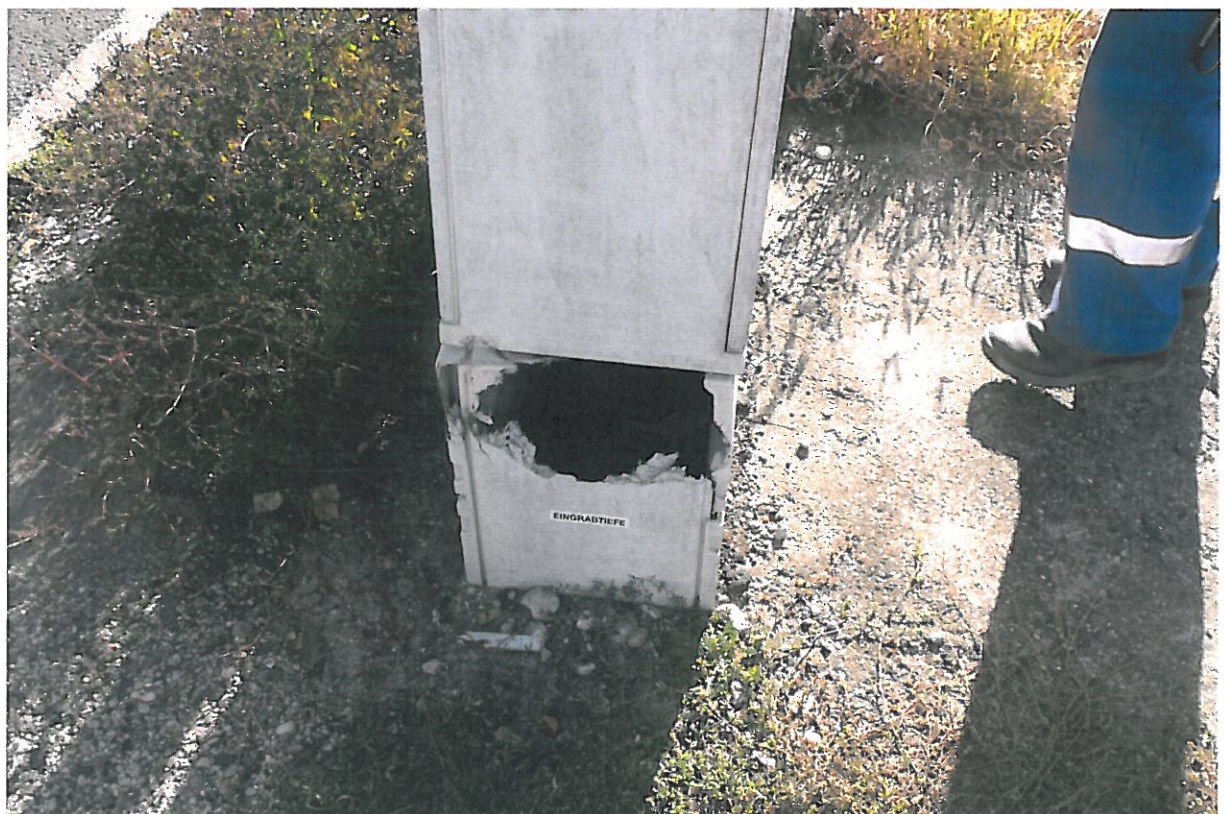
4. ábra megrongált szívóponthi szekrény