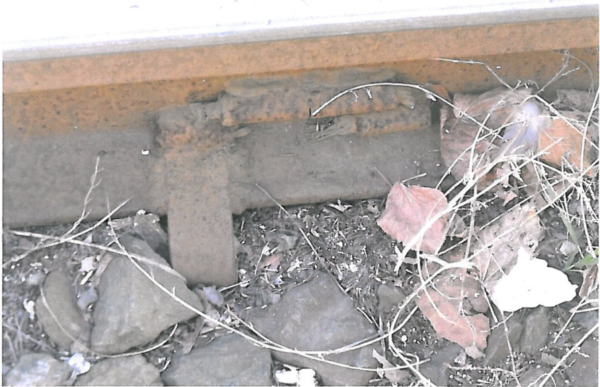
3. ábra Páskomliget 61. elkorrodált szívóponthi rákötés